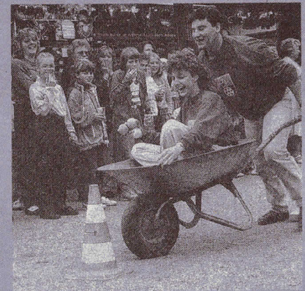
1989 war die Jugend noch sehr aktiv. Die Teilnahme an der Kerbe-Olympiade bereitete viel Freude.

der Sportplatz hinter der Carl-Zuckmayer-Schule fertiggestellt werden. Damit wurde der Weg zum Bau des heutigen Festplatzes im Brühl, Einweihung 1983, frei. m